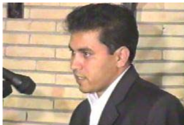
Yaghoub Mehrnahad, Journalist und Bürgerrechtler wurde hingerichtet

يعقوب مهريناهاد: دبيركنى النجمن جوانان صدای عدالت